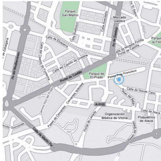
Delegación del Gobierno en la Comunidad Autónoma del País Vasco